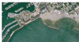
SCHÉMA DE LA ZONE DE BAINNADE

Nom de la zone de baignade : Saint Clair Commune : La Grande Motte / Département : Hérault / Région : Languedoc-Roussillon Population permanente de la commune (source INSEE - 2007) : 8246 habitants Population estivale estimée de la commune : 70000 (capacité d'accueil maximale) Personne responsable : Monsieur le Maire de La Grande Motte Période de la saison balnéaire : 15/06 au 15/09 Localisation du point de suivi (Lambert II) : X = 741 918 Y = 1 840 907 m Nature : sable Longueur : 400 m / Largeur moyenne : 50 m / Profondeur : 60 cm Activités : baignade, pêche Plages privées : 2 et présence de jeux